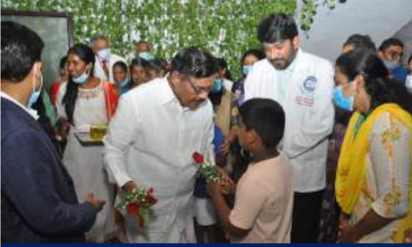
ஆட்டிசம் மையம் துவக்கவிழாவில் வேந்தர் அவர்கள்