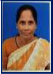
கோவிந்தம்மாள் சிங்கப்பெருமாள் கோயில்