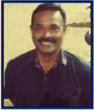
செந்தில் சிங்கப்பெருமாள் கோவில்

செப்டம்பர் / அக்டோபர், 2022 வள்ளி மருத்துவ செய்தி மடலில் வெளிவந்த வினாடி வினாவில் வெற்றிபெற்றவர்களின் விவரம் சமூக மருத்துவம் மற்றும் நல்ல ஆரோக்கிய தூதர்கள்