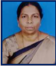
ஆண்டனி போர்ஷனின் மறைமலை நகர்