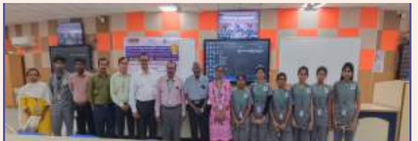
கண் மருத்துவத்துறை குழுவினருடன் அறக்கட்டளை குழுவினர்