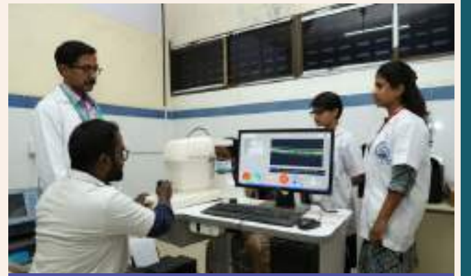
கண் பரிசோதனை செய்யும் காட்சி

மருத்துவக் கண்காணிப்பாளர் SRM மருத்துவக் கல்லூரி, பொத்தேரி